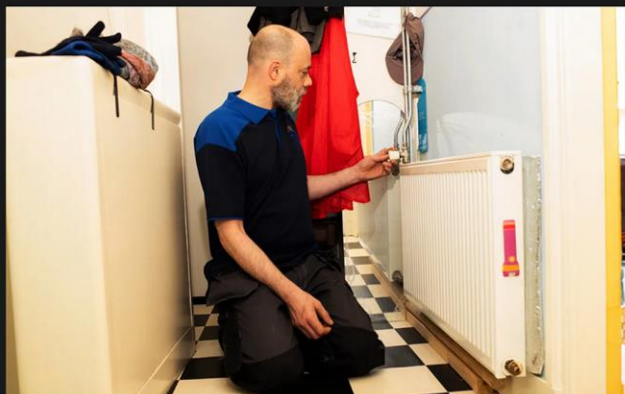
Met enkele kleine ingrepen kan al veel energie worden bespaard, zoals het goed afstellen van de CV en het plaatsen van tochtstrips en radiotorfolie. De FIXbrigade verzorgt dit gratis bij mensen thuis die het niet al te breed hebben.